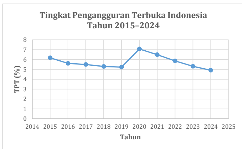
Gambar 2. Grafik Tingkat Pengangguran Terbuka (TPT) di Indonesia Tahun 2015–2024

Selanjutnya, data tersebut juga dapat disajikan dalam bentuk grafik untuk mempermudah melihat perkembangan tingkat pengangguran terbuka di Indonesia tahun 2015–2024: