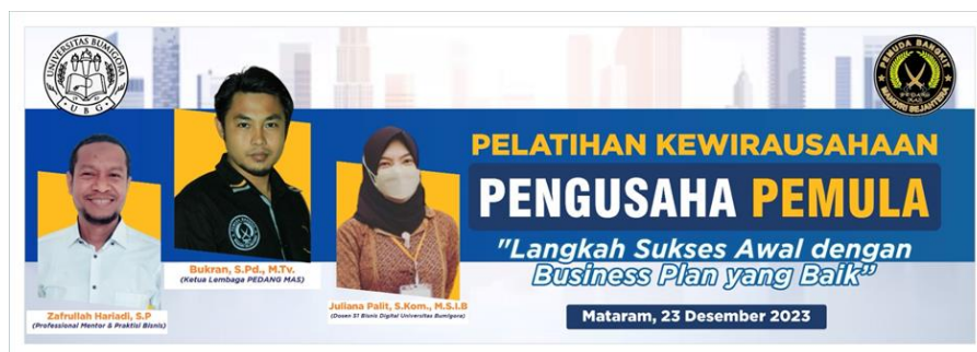
Gambar 2. Poster Kegiatan

Tim pengabdian yang berasal dari Universitas Bumigora Mataram bekerjasama dengan Organisasi Pemuda Bangkit Mandiri Sejahtera untuk menyelenggarakan kegiatan pengabdian ini. Adapun tujuan dari kerjasama ini adalah untuk dapat menghadirkan tidak hanya akademisi profesional dalam dunia bisnis dan bisnis digital namun juga mampu menghadirkan praktisi bisnis yang akan dapat memberikannya dari pengalamannya dalam berbisnis selama ini. Tentu pengalaman bisnis adalah guru yang sangat luar biasa dan ilmu dari pengalaman bisnis tersebut sangat berharga untuk dapat dibagikan kepada mitra yang dalam hal ini adalah mahasiswa Universitas Bumigora Mataram.