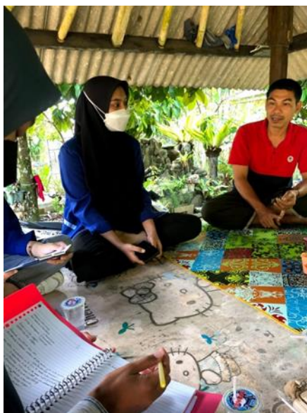
Gambar 6. Edukasi etika bisnis

Tim pengabdian menjelaskan ada beberapa hal yang perlu diperhatikan dalam menciptakan iklim etika bisnis yang baik yaitu pengendalian diri, pengembangan tanggung jawab sosial ( sosial responsibility ), mempertahankan jati diri dan tidak mudah untuk terombang ambing oleh pesatnya perkembangan informasi dan teknologi, serta menciptakan persaingan yang sehat. Ciri-ciri bisnis yang mempunyai etika baik diantaranya seperti tidak merugikan pebisnis atau usaha orang lain, tidak melanggar aturan hukum yang berlaku, tidak membuat suasana yang tidak kondusif pada saingan bisnisnya dan mempunyai izin usaha yang sah dan juga jelas.