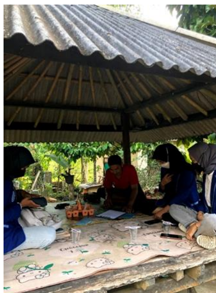
Gambar 4. Pengisian pre-test

Adapun item-item penting yang di tanyakan tim pengabdian saat wawancara dan pengisian dokumen pre-test yaitu: