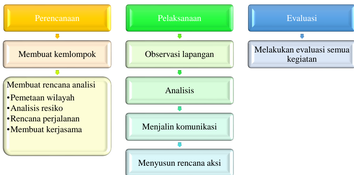
Gambar 3. Langkah kegiatan Participatory Action Research

Dengan memanfaatkan riset konvensional yang semakin berkembang, metode PAR dalam melaksanakan kegiatan memiliki banyak cara untuk mengumpulkan data di lapangan dan menganalisis seperti mencari data dengan bercerita ( sharing ) forum dilakukan dengan berdiskusi duduk bersila dan melingkar saling bertukar problematika dan bagaimana pemecahan masalah, wawancara ( interview ) bertujuan untuk mengetahui sejauh mana perkembangan UMKM dan terdapat faktor yang kurang menguntungkan untuk peningkatan citra produksi serta diskusi kelompok (FGD) untuk menunjang kestabilan perkembangan UMKM. Dalam penerapan metode PAR terdapat 3 langkah yaitu perencanaan, pelaksanaan dan evaluasi seperti yang di gambarkan pada bagan dibawah ini.