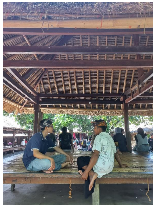
Gambar 4. Pelaksanaan kegiatan penyuluhan dan diskusi reflektif

Selama pelaksanaan penyuluhan, tantangan yang dihadapi oleh Guide dalam meningkatkan kualitas pelayanan telah diidentifikasi. Meskipun Desa Sade menawarkan potensi yang besar sebagai destinasi wisata budaya, masih terdapat beberapa tantangan yang dihadapi dalam menjaga kualitas pelayanan guide. Beberapa di antaranya termasuk: