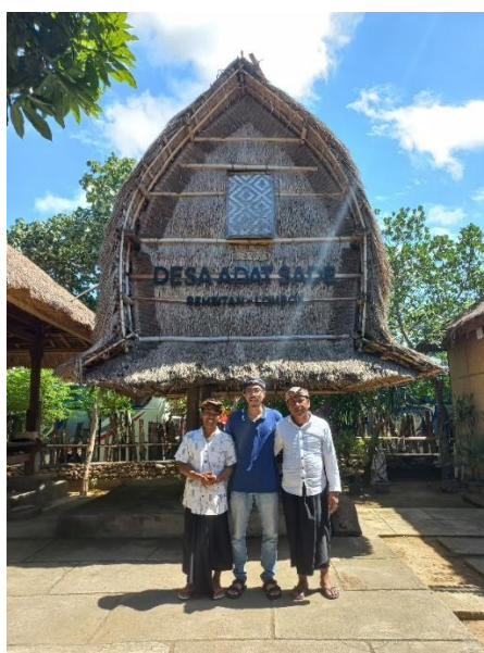
Gambar 1. Desa Adat Sade

. Desa Sade, sebuah permata tersembunyi di Lombok Tengah, Indonesia, telah lama menjadi destinasi yang menarik bagi para wisatawan yang mencari pengalaman budaya yang kaya dan autentik. Terletak di tengah perbukitan yang mempesona, Desa Sade terkenal dengan rumah-rumah tradisionalnya yang unik, kain tenun ikat Sasak, dan keramahan penduduknya. Namun, untuk mempertahankan daya tariknya sebagai destinasi wisata yang berkelanjutan, penting untuk memperhatikan kualitas pelayanan, terutama dari para guide lokal yang berperan sebagai duta budaya dan penuntun pengalaman wisatawan. Dalam artikel ini, kami akan membahas tentang hasil penyuluhan mengenai kualitas pelayanan bagi guide di Desa Sade, Lombok Tengah, serta langkah-langkah yang dapat diambil untuk meningkatkan pengalaman wisata yang berkelanjutan di destinasi ini.