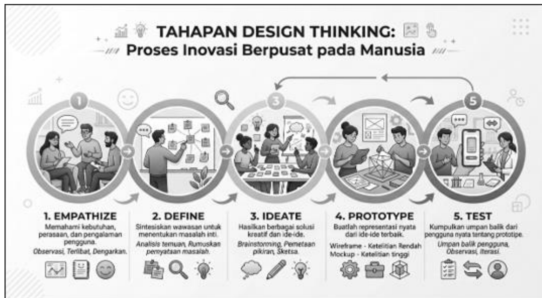
Gambar 1. Tahapan Design Thinking