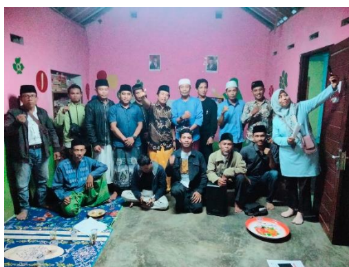
Gambar 2. Sosialisasi seni musik untuk belajar Bahasa inggris

Dari pelaksanaan kegiatan, tidak lupa untuk memberikan evaluasi dari serangkaian kegiatan yang sudah di laksanakan di Kuta, Lombok Tengah. Evaluasi ini bertujuan untuk mengetahui seberapa besar dampak dari sosialisasi ini dan hasil dari penanganan kegiatan tersebut. Hasil yang didapatkan dari sosialisasi ini sangat berpengaruh untuk keberlangsungan dalam dunia wisata terutama penggunaan bahasa inggris demi kelancaraan komunikasi. Warga sekitar sangat antusias dan bisa mendapatkan manfaat yang sangat signifikan sehingga mereka mulai belajar dan menerapkan ke dalam percakapan sehari-hari untuk melatih keluwesan dalam kecakapan bahasa inggris.