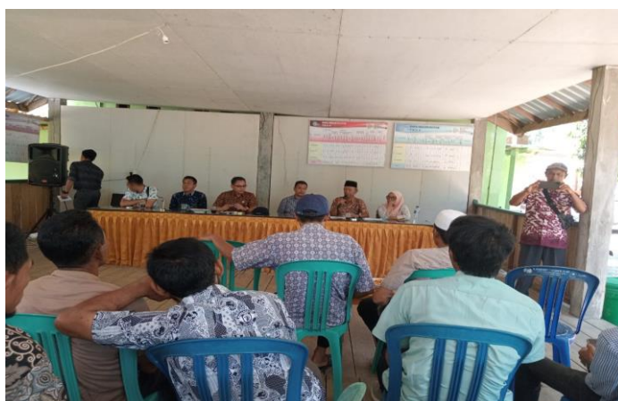
Gambar 2. Proses penyampaian materi pelatihan

belajar peserta, tetapi juga membangun komunitas belajar yang mendukung pertumbuhan dan pengembangan kolektif.