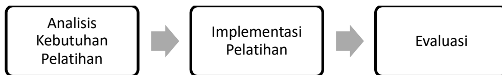
Gambar 1. Tahapan pelaksanaan pelatihan

Pelatihan penggunaan aplikasi keuangan untuk memaksimalkan pengelolaan UMKM memerlukan pendekatan sistematis dan interaktif untuk memastikan pemahaman yang optimal. Tahapan pelaksanaan pelatihan ini mengikuti tahapan yang telah diuraikan oleh Turwelis (2019), berikut ilustrasinya: