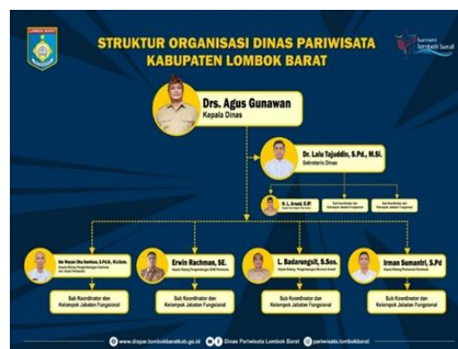
Gambar 2. Struktur Organisasi Dinas Pariwisata Lombok Barat

Berikut inilah struktur organisasi pada Dinas Pariwisata Lombok Barat secara keseluruhan;