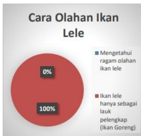
Gambar 5. Diagram kedua

Pada Diagram pertama dijelaskan bahwa sebanyak 70% Masyarakat Desa yang diwakili oleh kader Ibu-ibu PKK dan Kader Kesehatan yang berjumlah 12 orang telah mengetahui kandungan gizi yang ada pada ikan lele.