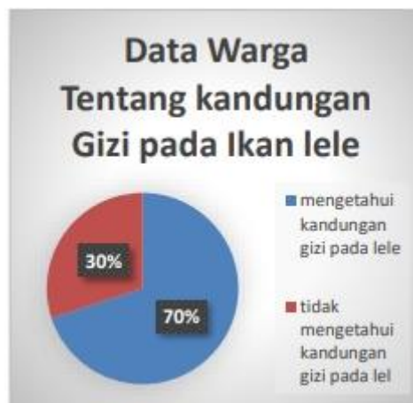
Gambar 4. Diagram pertama

Dari kegiatan sosialisasi tersebut dapat diketahui bahwa 70% kesadaran masyarakat tentang gizi yang terkandung dalam ikan lele, yang dapat dijadikan salah satu pangan dengan nilai gizi yang tinggi bagi balita. Hal tersebut dapat diketahui dari hasil survey saat sosialisasi yang dihadiri oleh 12 orang sebagai perwakilan dari masyarakat desa Margomulyo saat mengikuti sosialisasi. Namun dalam hal pengolahan masih 100% masyarakat bingung untuk mengolah olahan ikan lele selain dalam bentuk lauk (ikan goreng). Sehingga ikan lele hanya dijadikan lauk bagi masyarakat yang sudah dewasa. Oleh karenanya diharapkan dengan sosialisasi ini dapat menabuh wawasan bagi para orang tua khususnya yang berada di desa Margomulyo tentang banyaknya jenis olahan ikan lele sehingga bisa di nikmati oleh masyarakat secara keseluruhan mulai dari balita, anak-anak, hingga dewasa. Berikut data tentang hasil survey yang dilakukan di desa Margomulyo.