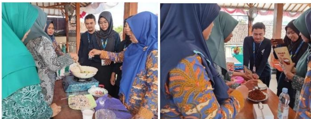
Gambar 6. Pelatihan Pembuatan dan pengemasan Abon Lele Sebagai Produk Pangan Bergizi Di Desa Margomulyo, Bojonegoro

Selanjutnya pada tahap pengemasan, ibu-ibu warga desa Margomulyo yang mengikuti pelatihan tersebut diajak secara langsung dalam praktik pengemasan yang di pandu oleh mahasiswa. Dalam praktik tersebut mahasiswa memberikan arahan tentang abon yang harus di keringkan terlebih dahulu, dan bagaimana abon yang tidak bisa di masukkan dalam keadaan panas-sampai pada tahap pengemasan selesai. Dari tahapan tersebut dapat diketahui antusiasme ibu-ibu desa Margomulyo yang terdiri dari ibu-ibu PKK dan Ibu-ibu kader kesahatan balita yang berjumlah 12 orang, sangat antusias menyimak dan mempraktikkan langgung apa yang telah menjadi hasil olahan mereka saat praktik pembuatan abon lele.