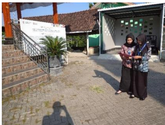
Gambar 2. Observasi Lingkungan di Desa Margomulyo, Bojonegoro

Namun, dikarenakan balita tidak dapat mengkonsumsi ikan lele secara langsung, maka dibuatlah proyek berupa pengolahan ikan lele dalam bentuk abon, sehingga tidak hanya orang dewasa saja yang dapat mengkonsumsinya.