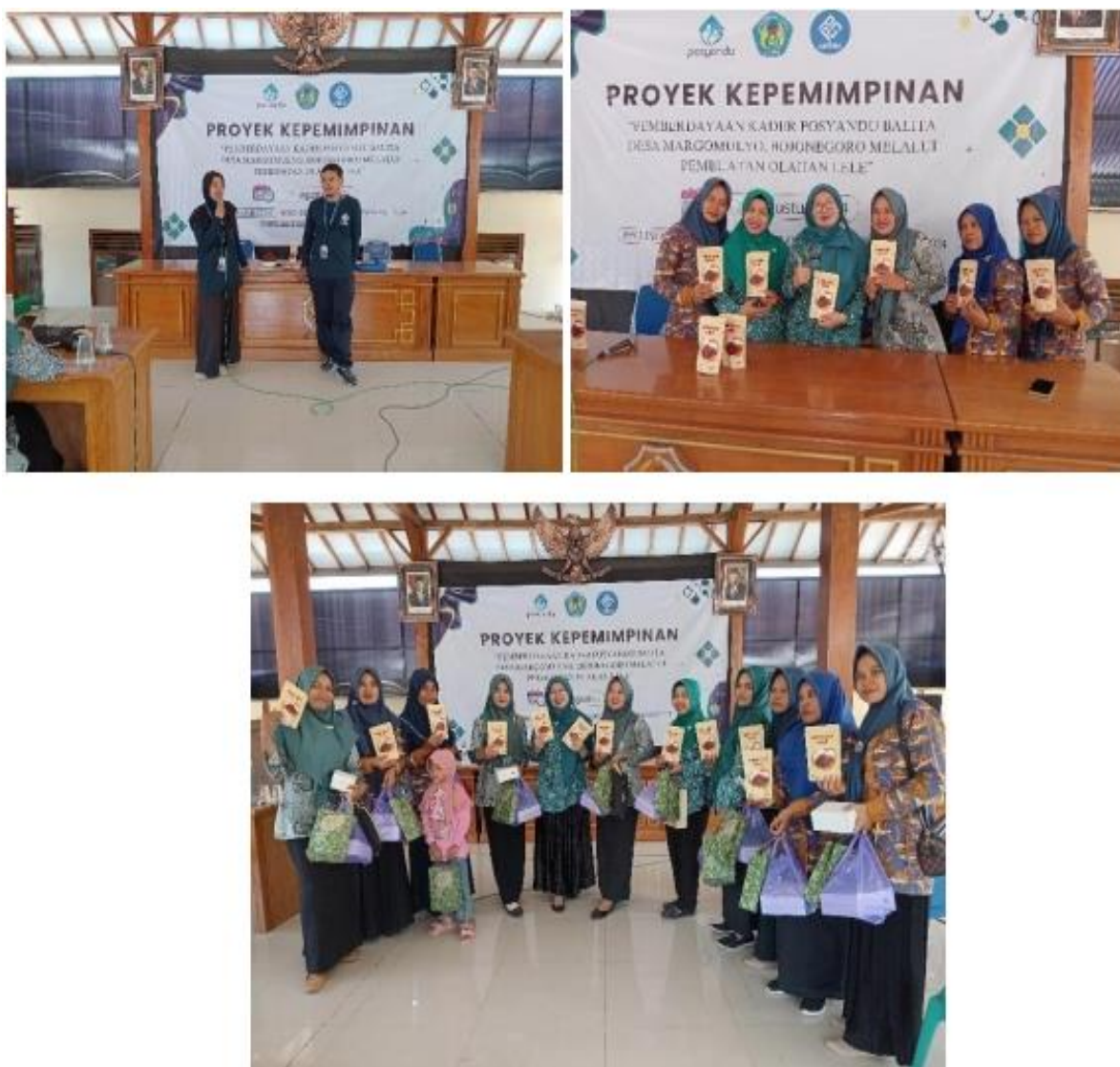
Gambar 7. Sosialisasi Pemasaran Abon Lele Sebagai Produk Pangan Bergizi Di Desa Margomulyo, Bojonegoro

Pada tahapan ini, mahasiswa UNIPMA yang berjumlah 12 orang memberikan arahan dan sosialisasi tentang pemasaran abon lele sebagai salah satu produk pangan bergizi untuk balita. Dalam pemasaran tersebut mahasiswa membimbing dan memberikan arahan kepada ibu-ibu desa Margomulyo yang hadir tentang bagaimana cara memasarkan hasil abon lele yang telah di buat. Dalam hal ini, pemateri yang di isi oleh mahasiswa UNIPMA sendiri memberikan arahan bahwa dalam memasarkan dapat dilakukan baik dengan cara online maupun off line . Online disini, pemateri memberikan banyak contoh plat form yang bisa di pakai untuk memasarkannya, diantaranya, shoppe, Lazada, dll. Adapun untuk offline lebih ke bagaimana cara ibu-ibu untuk memasarkan kepada sesame rekan PKK dan kader-kader lain, dan juga pada masyarakat sekitar.